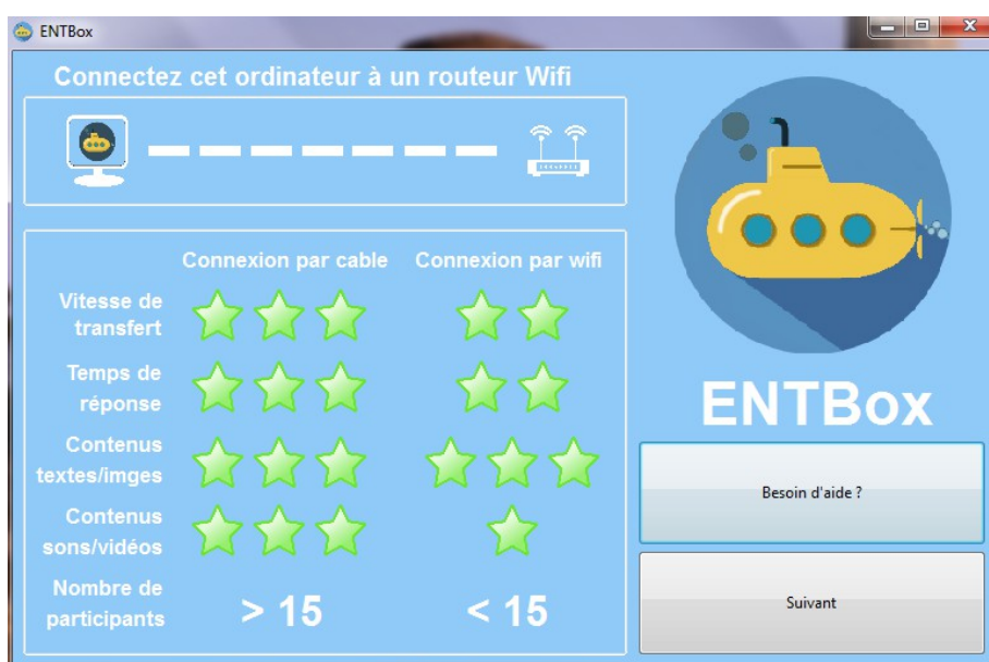
Schermata di avvio

Il docente clicca sul pulsante “Demarrer” e poi comunica l'indirizzo indicato agli studenti, nell'esempio seguente 192.168.1.101